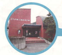
さくま郷土遺産保存館 W.C