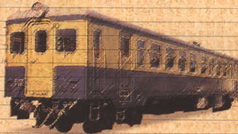
4月 車両特別公開 ※3/28,19公開 【キハ48000形】

(クヤ165-1) 直流教習制御車 サハシ153形直流普通会堂付随車を昭和49年に改造。運転士を教育するための直流教習制御車として生まれ変わった。